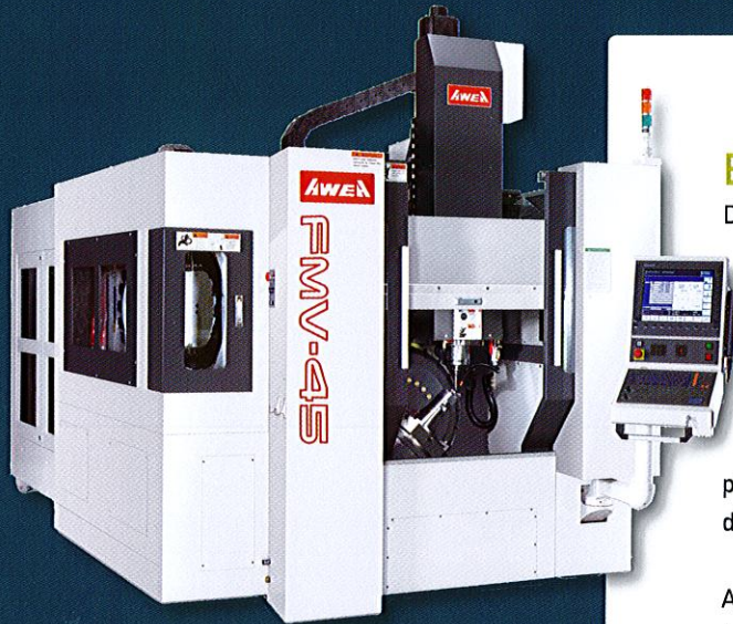
5 axes plateau Ø 450 mm