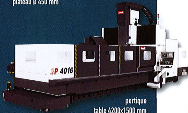
portique table 4200x1500 mm